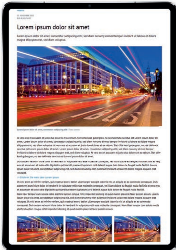
*Bilder & Texte Muster